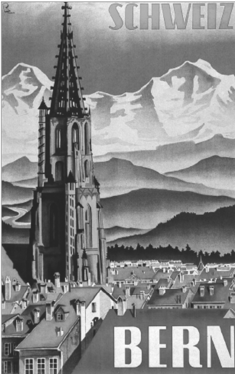
Babylonia 2/2001, Vecchia cartolina di Berna.

3. Die Amtssprachen des Bundes Artikel 70 Absatz 1 BV übernimmt