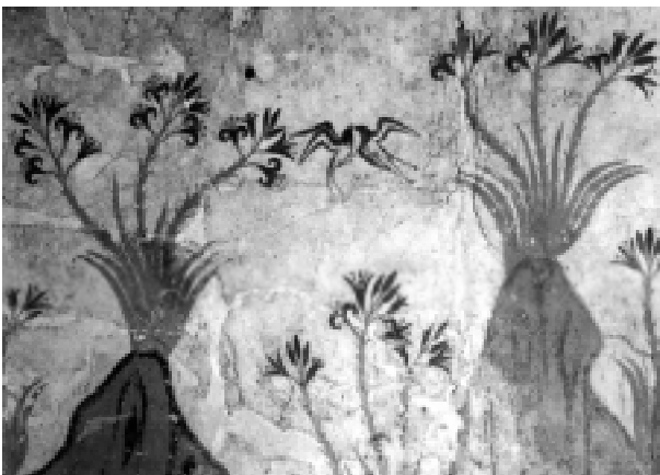
Affreschi di Akrotiri (Santorini).

Voilà. Alors mon fils qui a maintenant 20 ans, lorsqu'il rentre en Grèce, il se fait comprendre facilement, il a des entretiens avec les gens qu'il connaît, il affiche beaucoup d'intérêt, de nouveau, depuis deux ans. Et ma fille, lorsqu'elle est en Grèce également, avec des copines et des cousines, elle exerce plus son grec, davantage. Voilà.