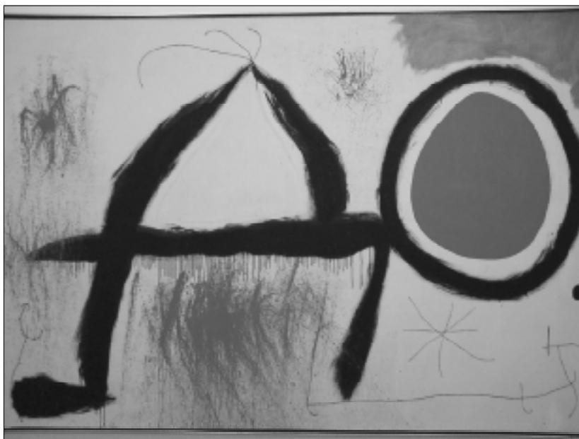
Joan Miró, Dipinto .

Quatorze cantons de Suisse alémanique ont fait le choix de l'anglais. Zurich a généralisé son enseignement dès la 2 e année primaire en 2004/2005, Appenzell Rhodes Intérieures en 3 e année dès 2001/2002. Dans ce canton, l'étude du français a été repoussée de la 5 e année à la 7 e année, soit au secondaire I. Il n'en va pas de même dans les Rhodes Extérieures qui envisagent d'introduire l'anglais en 3 e année, plutôt qu'en 7 e , tout en gardant le français en 5 e année. En Suisse centrale, cinq cantons (NW, OW, SZ, UR, ZG) ont opté pour l'anglais et son enseignement a commencé dès la 3 e année à la rentrée 2005. A Lucerne, l'apprentissage du français commence en 5 e année et celui de l'anglais en 7 e . Le 9 septembre 2004, le Grand Conseil soumit la proposi-